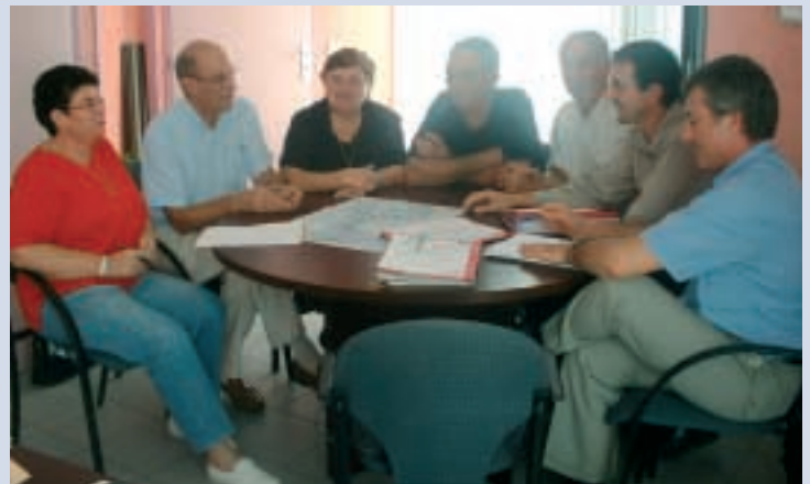
Réunion de travail sur le collecteur d'assainissement

ce fut aussi l'occasion de cette nouvelle activité ; d'autres cette journée pour s'initier aux cours avec les sapeurs pompiers pour admirer le talent des jeunes hip-hop de “Paroles de Saint-Vallier” dans le cadre intercommunale jeunesse .