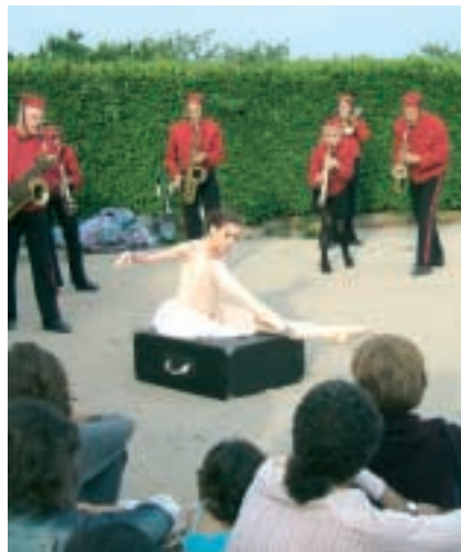
«Les ballets Grooms» à Eclassan

Les étrangers sont toujours aussi nombreux (belges, néerlandais et anglais) et les touristes français sont en nette progression. Ils connaissent bien le sud de la Drôme et sont enchantés par le Nord : « Nous reviendrons l'année prochaine ! ». Autre constatation : le nombre de touristes a explosé en septembre, grâce à cette météo quasi estivale. Rappelons que l'Office de Tourisme est