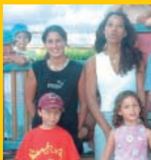
petite enfance jeunesse

Arras/Rhône | Eclassan | Laveyron | Ozon | Ponsas | Saint-Barthélémy-de-Vals | Saint-Vallier | Sarras