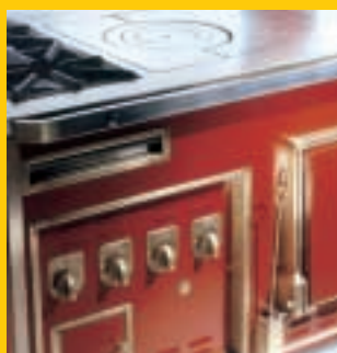
made in 2 rives