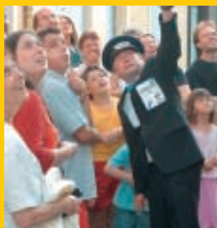
d'une rive à l'autre...